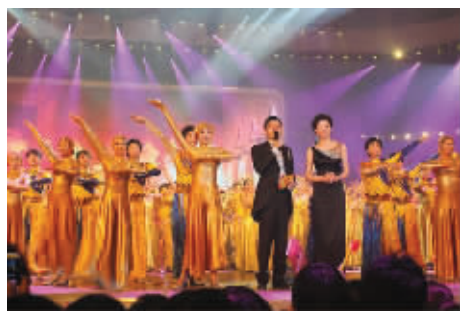
央视董卿和湖南卫视汪涵共同主持开幕式。