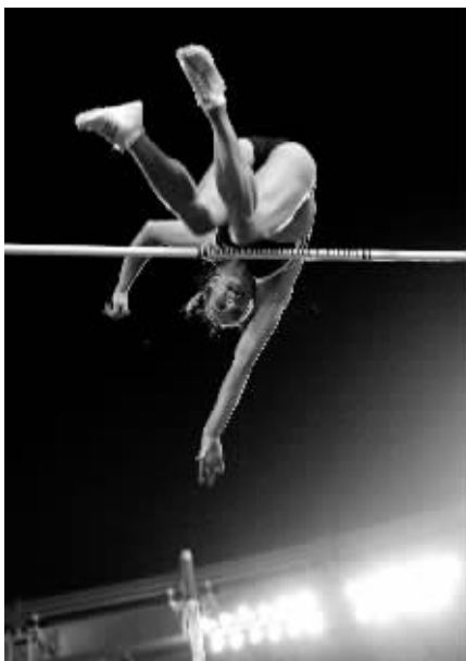
伊辛巴耶娃刷新纪录瞬间。

原世界纪录是今年 26 岁的伊辛巴耶娃 2005 年 8 月在芬兰赫尔辛基进行的第十届世界田径锦标赛上创造的。当时，她以 5 米 01 的成绩打破了自己保持的 5 米 01 的世界纪录，并获得冠军。