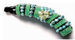
很有民族味道的发夹