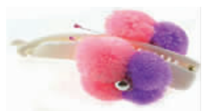
绒毛装饰显得十分甜美