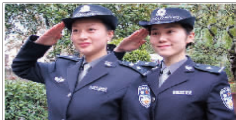
“边城杯”走近警察征文