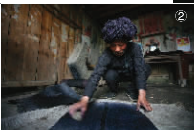
⑦晾晒在春风阳光里。