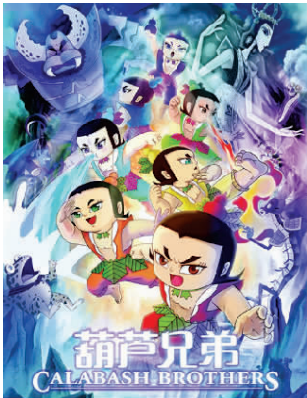
难忘的国产经典动画《葫芦兄弟》。

上海美术电影制片厂于5月末推出的电影版《葫芦兄弟》,在不到三个星期的时间,全国票房高达800多万元,创下近几年国产动画片票房之最。面对如此佳绩,上海美影厂也表示,很有可能拍摄真人版《葫芦兄弟》,将这个经典的动画形象延续下去。