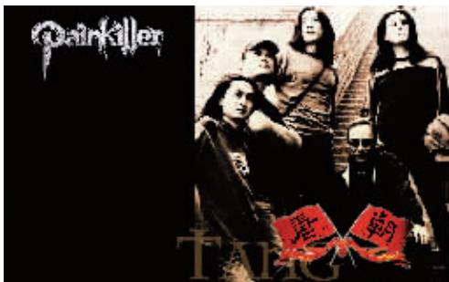
唐朝乐队是中国坚持最久的摇滚乐队。