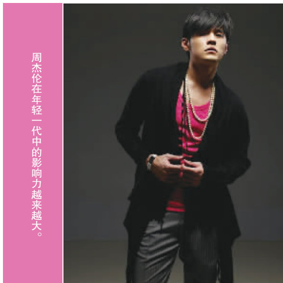
周杰伦在年轻一代中的影响力越来越大。